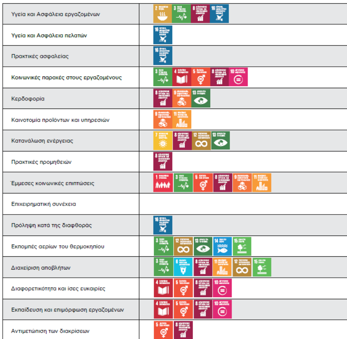
Πίνακας 9. Ουσιαστικά θέματα Ομίλου INTRAKAT 2023

Στο πλαίσιο προετοιμασίας της δεύτερης έκθεσης Βιώσιμης Ανάπτυξης, που αφορά στο έτος 2023, πραγματοποιήθηκε εσωτερική διαβούλευση όπου και αποφασίστηκε η διατήρηση των ήδη αναγνωρισμένων θεμάτων Βιωσιμότητας, τα οποία και αναφέρονται παρακάτω με τυχαία σειρά και σε συνδυασμό με τους Στόχους Βιώσιμης Ανάπτυξης: